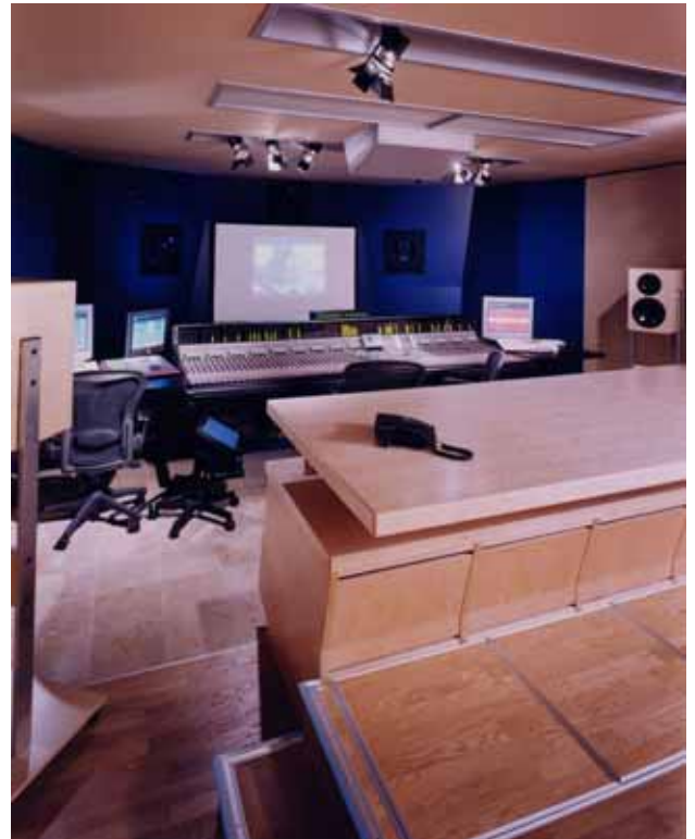
TV 5.1 Mischung

SDI zeichnete sich für die Planungs- und Bauabwicklung der Elektro- und Studioteknik, studioteknische Einrichtungen, Netzwerk- und Kommunikationstechnik verantwortlich