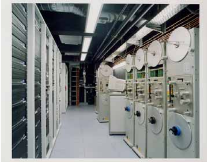
Zentraler Projektionsraum / ZGR Mischatelier

so dass in den Transferstudios alle gebräuchlichen Formate ein- und ausgespielt werden können.